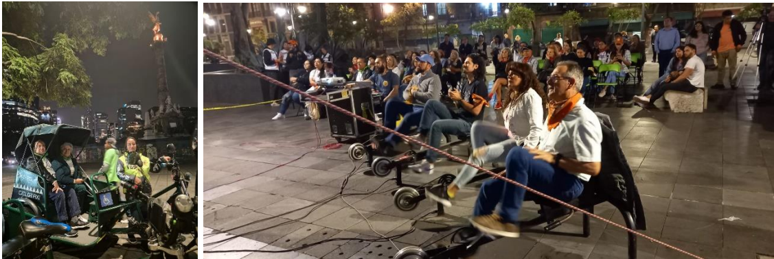
Imágenes 16 y 17. MoviliTour y CineDebate