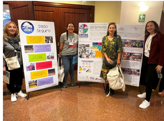
Imágenes 18 y 19. Posters de las asociaciones JAIME, GABI BICI BLANCA y Fundación Mónica Licón.