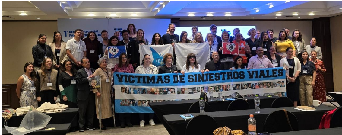
Imagen 15. Cierre segunda jornada de trabajo.