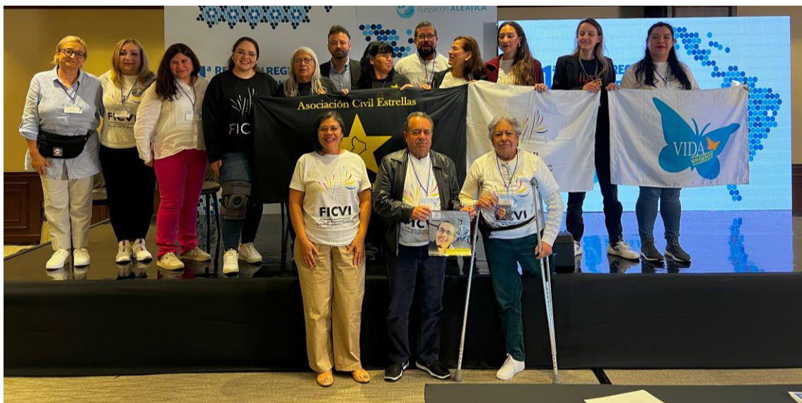
Imagen 14. Foto grupal de cierre de taller